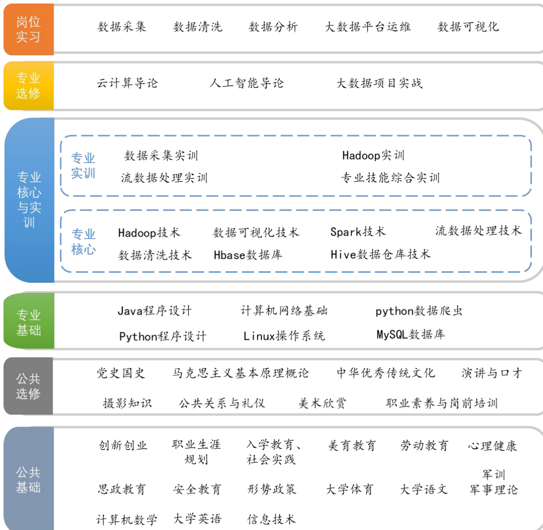
图 2 课程结构图