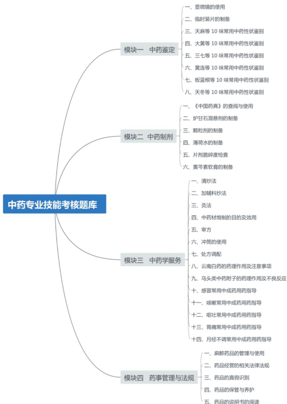
图 3-1 专业技能考核内容

常见各类药材的性状鉴定 8 个基本操作项目；中药制剂模块包括中国药典查阅和各类常规剂型的制备 6 个基本操作项目；中药学服务包括中药炮制、中药调剂、中药药理、常见中成药用药指导共计 14 个基本操作项目；药事管理包括药品真假识别等 5 个基本操作项目。本题库共计 33 个项目（33 个试题），所有考核试题的集合组成考核题库。