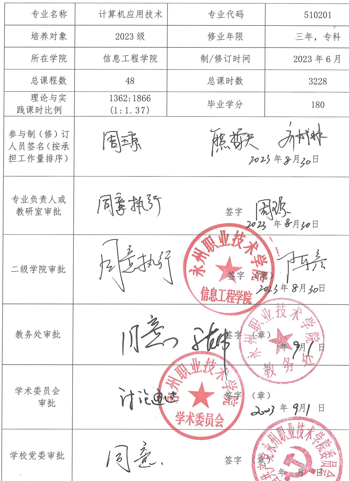
2023 级（版）人才培养方案制（修）订审核意见表